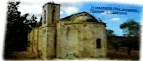
Η εκκλησία του χωριού Νέτα