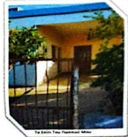
Το Σχολείο του χωριού Νέτα

Η Νέτα είναι χωριό της επαρχίας Αιτωλοακαρνανίας στη χερσόνησο της Καρπατίας, στα 61 χιλιόμετρα βορειοανατολικά της πόλης Αιτωλικού. Βρίσκεται στην καταχρησμένη παραλία της Κίψου από το 1974, από τα τουρκικά στρατεύματα της εισβολής. Στα όρια του χωριού είναι τα κρατικά δάση Ισόκος και Ζορράς. Γειτονικά χωριά είναι ο Βαθύλακας, Άγιος Σωμίων, Λιθόρυγχια και το Λεονόρισσο.