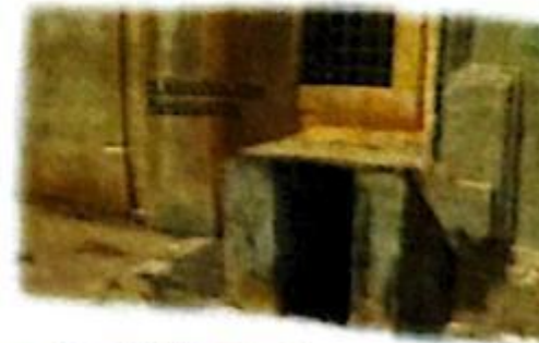
Ανάκλιμα της εκκλησίας