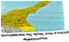
ΝΟΤΙΟΑΝΑΤΟΛΙΚΑ ΤΗΣ ΝΕΤΑΣ ΣΤΗΝ ΕΠΙΧΩΡΙΟ ΑΛΑΞΑΝΔΡΟΥΠΟΛΙΣ