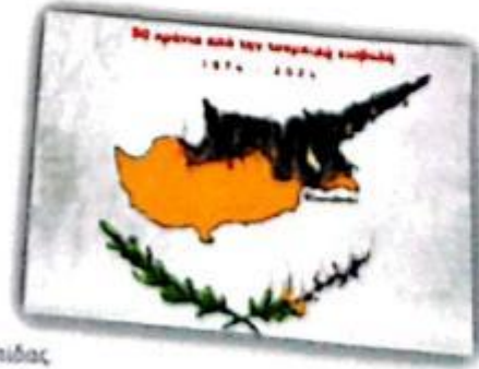
50 χρόνια από την τουρκική εισβολή 1974 - 2024