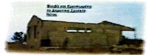
Βαθύλακας, Επαρχία Αιτωλικού