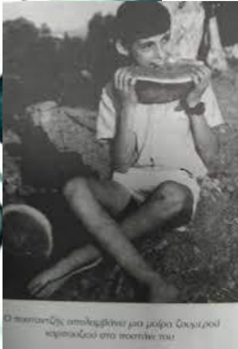
Ο ποσειδωνικός απολαμβάνει μια μούρα Σουσιέ/ρού καρπιακού στο ποσειδών του!

Το Πάνω και κάτω Κήπος δεν είναι τυχαίο αφού το χωριό φημίζεται για τα ωραία του γεωργικά προϊόντα. Οι κάτοικοι ασχολούνταν κυρίως με την γεωργία, είχαν πολλούς πορτοκαλεώνες, λεμονιές, γκρέιπφρουτ καρπούζια, πατάτες καρότα και άλλα πολλά. Η γιαγιά μου λέει ότι την άνοιξη, όταν έφτανες στο χωριό σου έσπαζαν τη μύτη οι μυρωδιές από τους ανθούς των πορτοκαλιών.