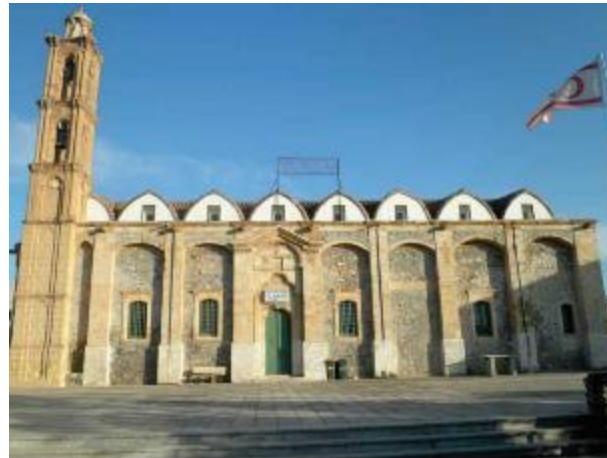
Η βόρεια πλευρά του Τιμίου Σταυρού/ The northern side of the Holy Cross church