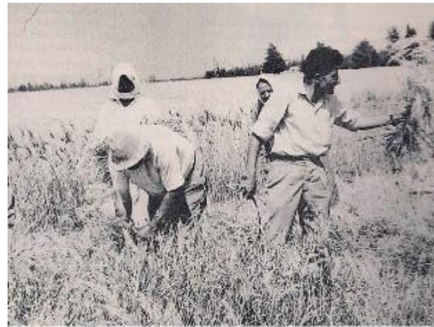
Θερισμός στην Κάτω Ζώδεια/ Harvest in Kato Zodeia