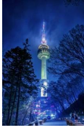
N Seoul Tower