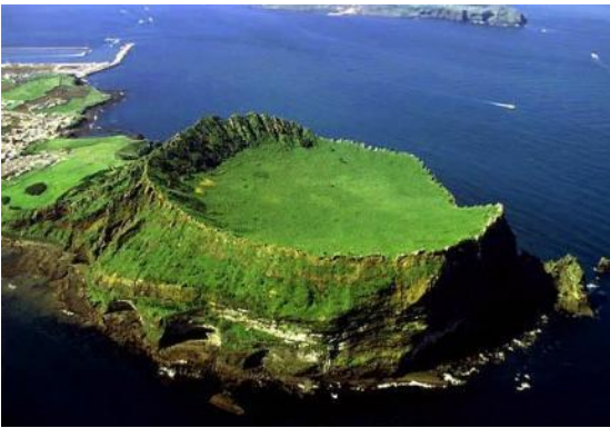
Seongsan Ilchulbong (Sunrise Peak)