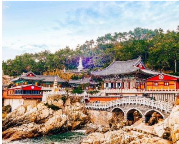
Haedong Yonggungsa Temple